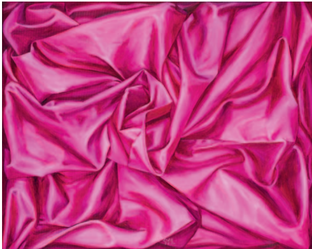
Farbfalten 4 2023, Öl/Lwd., 80 x 100 cm

Schlehecks Gemälde sind Bilderrätsel im eigentlichen Sinn. Jahrhundertaltes Personal der Kunstgeschichte begegnet darin zeitgenössischen Akteuren, versehen mit aktuellen Anspielungen. Man kann Schlehecks begeistertes Publikum dabei beobachten, wie es um die Bilder ringt – nicht um die der Künstlerin, sondern um die im eigenen Kopf. Die Faszination bleibt allemal.