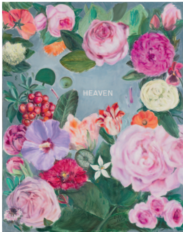
Blumen 8 Heaven, 2021, Öl/Lwd., 80 x 100 cm

Wer – um alles in der Welt – ist Rudi? Schon der Titel der Ausstellung von Sigrun C. Schleheck wirft die erste Frage auf. Wer sich allerdings von einem Besuch im Roten Haus Meersburg eine Antwort darauf verspricht, wird vermutlich enttäuscht. Es ist nicht unwahrscheinlich, dass man die Ausstellung mit mehr Fragen als zuvor verlässt.