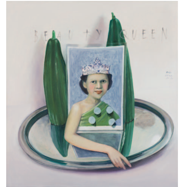
Aus dem Garten der Dinge / StillLeben 4: Beauty Queen 2018/2020, Öl/Lwd., 80 x 74 cm

Schleheck kennt keine gedanklichen Grenzen – und wenn doch, überwindet sie sie im Nu. Ihr Bilderkosmos ist fantasievoll, unkonventionell und voll verschmitztem Humor. Und darin bleibt er auf bemerkenswerte Weise stabil, so überraschend jedes einzelne Werk auch sein mag. Nicht umsonst zählt die Kulturpreisträgerin des Jahres 2023 zu den wichtigsten Künstlerinnen der Region.